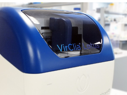
Acceso Random , carga continua.