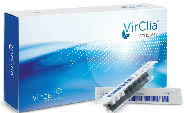
VirClia ® MONOTEST - 24 tests