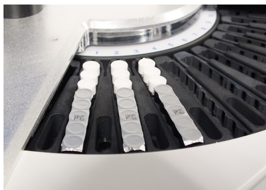
Total flexibilidad, función STAT.